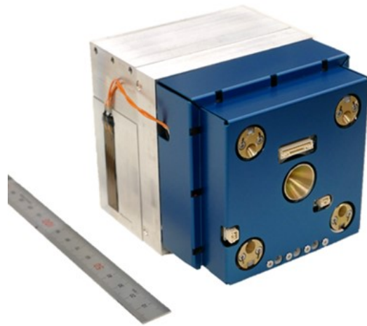
図6 小型衛星推進ユニット軽量化プロジェクト