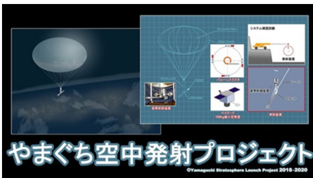
図5 やまぐち空中発射プロジェクト

当財団としても、航空宇宙分野参入を戦略的に取り組むことにより、他の産業との接点が生まれ、企業間マッチングを促進することができた。当財団の令和元年度実績は、取引成立件数143件、当初成立金額約15億8,000万円と、過去最高額となった。