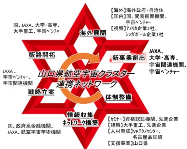
図4 連携ネットワーク

軽量化をテーマに、既存技術と新素材/新加工技術との融合による差別化戦略の基、当財団での取引/技術マッチングと企業/機関等との連携促進により、国内外での販路拡大、新事業展開につながった。クラスター参画企業は、JAXAや