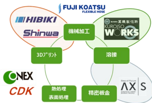
図1 山口県航空宇宙クラスター体制図

また難燃性マグネシウム合金や炭素繊維複合材といった新素材と、レーザーや3Dプリンターといった新加工技術に着目し、差別化戦略を進めた(図2)。これらにより、業界の大きな